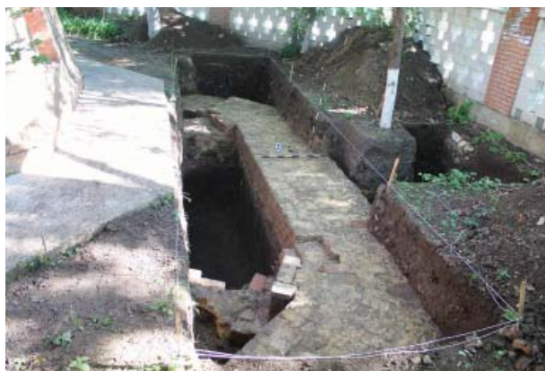
Foto 2. Secțiunea I, temelia balconului-terasă