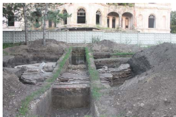
Foto 5. Secțiunea V. Havuzul 2, amplasat în fața Palatului princiar