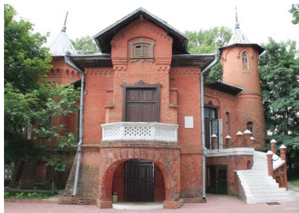
Foto 1. Castelul de Vânătoare, actualul sediu al Muzeului de Istorie și Etnografie din or. Hâncești

Centrul de Arheologie, Institutul Patrimoniului Cultural al AȘM