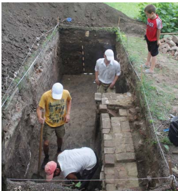
Foto 6. Secțiunea VI. Porțiunea fundamentului construcției de lângă Casa Vechilului

sud-est (casetele II și IIa), care au demonstrat continuarea amenajării de cărămidă. Astfel, prin această primă descoperire care prezenta fundamentul balconului-terasă a Castelului, a fost dovedită o dată în plus însemnătatea cercetărilor arheologice efectuate cu prilejul lucrărilor în proiectele de reconstrucție și restaurare a edificiilor arhitecturale datând din perioade istorice mai recente.