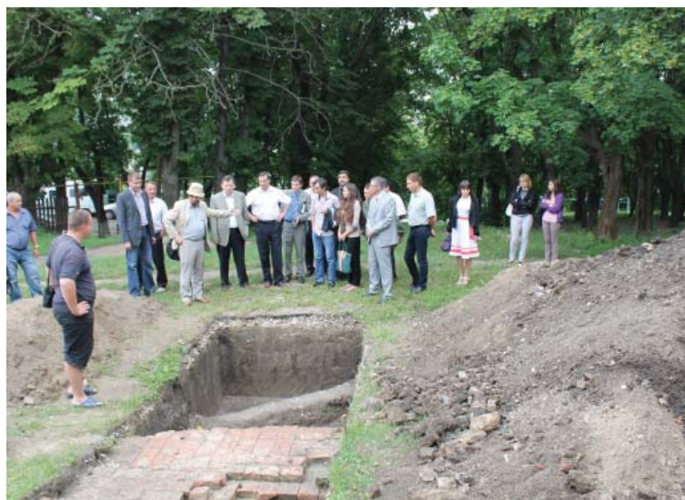
Foto 7. Participanții la lansarea oficială a proiectului de restaurare a Complexului Manuc Bey. 3 iulie 2013