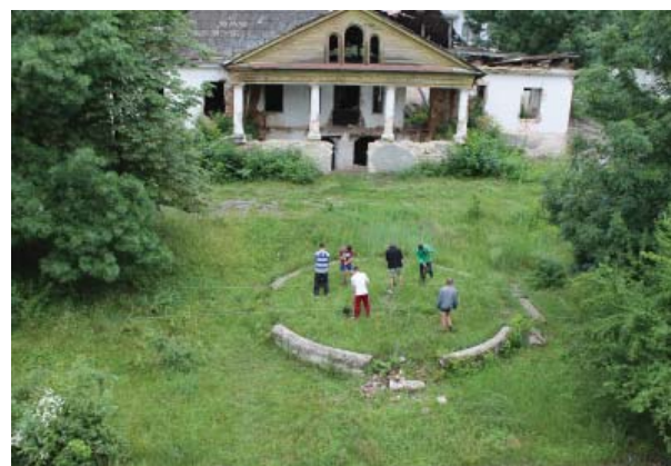
Foto 3. Trasarea secțiunii II în fața Casei Iamandi