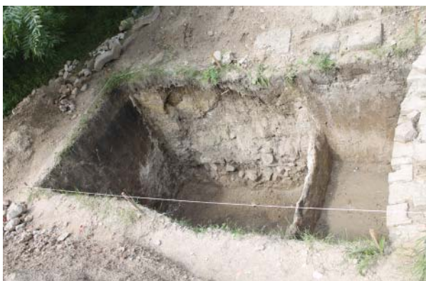
Foto 4. Secțiunea II, groapa 1

Secțiunea I a fost trasată în partea de est a Castelului de Vânătoare (fig. 1), adică în zona unde arhitecții presupuneau că inițial clădirea a avut un balcon. Și într-adevăr, la o adâncime de cca 0,5 m, sub un strat intermediar de moloz constând din fragmente de cărămidă roșie, bucăți de mortar cenușiu, pietre și nisip, a apărut stratul compact de cărămizi întregi, legate printr-un liant de lut galben nisipos (foto 2). Ulterior, Secțiunea I a fost completată cu trei casete trasate lateral, spre nord-est (casetă I) și